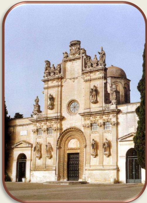
Chiesa dei SS. Niccolò e Cataldo. Lecce

La sezione di Geografia svolge attività di ricerca e didattica su tematiche ambientali e culturali, anche legate al turismo, e più spesso promosse da accordi/convenzioni stilati con enti pubblici e privati.